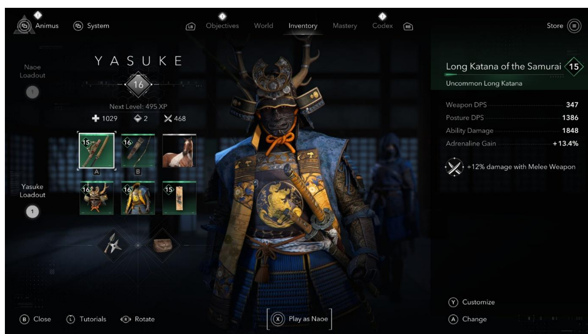
Figur 2. Yasukes stridvärden ( Assassin's Creed Shadows . Ubisoft (2025)).

Utvecklingssystemet erbjuder Yasuke uppgraderingar fokuserade på ökad skada, mer hälsa, nya stridskombinationer och högre uthållighet i strid. Naoes uppgraderingar fokuserar på smygförmågor, parkourtekniker och lönnmord.