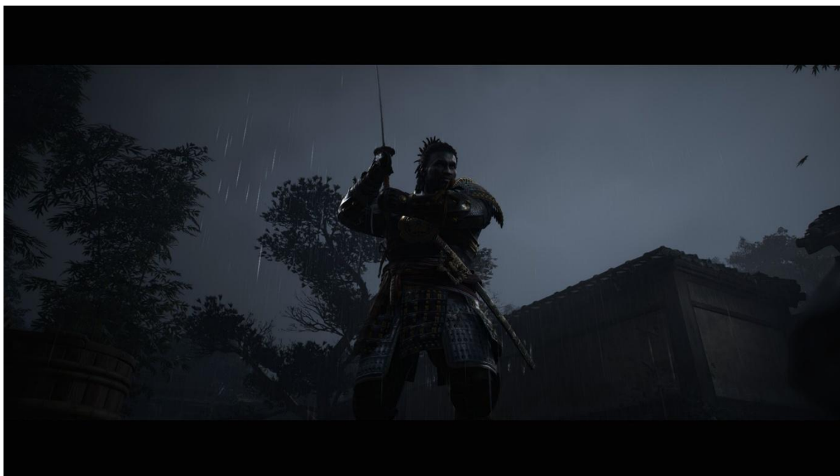
Figur 1 Yasuke. Assassin's Creed Shadows (2025)

Performance rules definierar vilka handlingar en karaktär kan utföra. Detta kommunicerar vilka handlingar som är viktiga för karaktären (Pérez Latorre, 2015). För Yasuke kommunicerar dessa regler maskulinitet genom övervägande kraftfulla möjligheter.